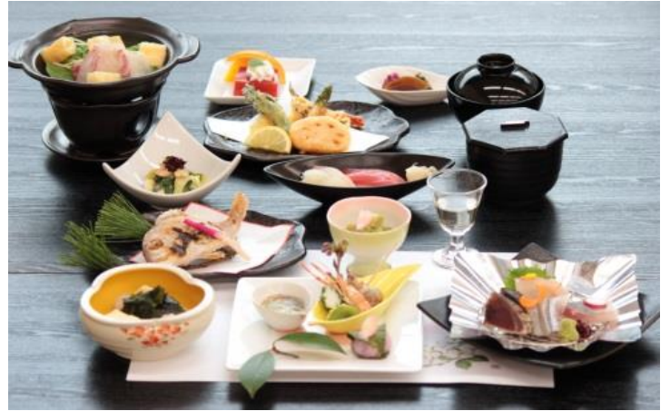
【雅 ¥6000(税別)イメージです】